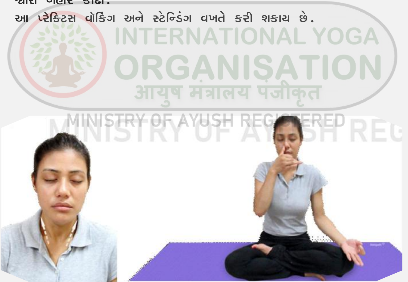
ફિગ. 6.7 : ઉજ્જયી પ્રાણાયામ

આ પ્રેક્ટિસ વોર્કિંગ અને સ્ટેન્ડિંગ વખતે કરી શકાય છે.