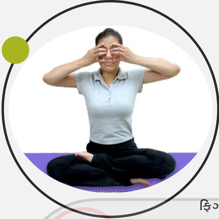
ફિગ. 6.6 : ભ્રામરી પ્રાણાયામ