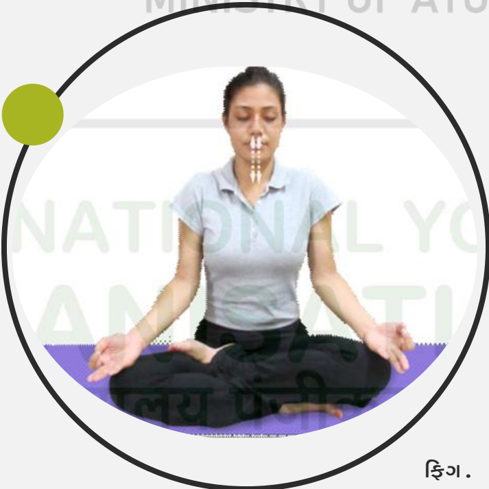
ફિગ. 6.8 : ભસ્ત્રિકા પ્રાણાયામ