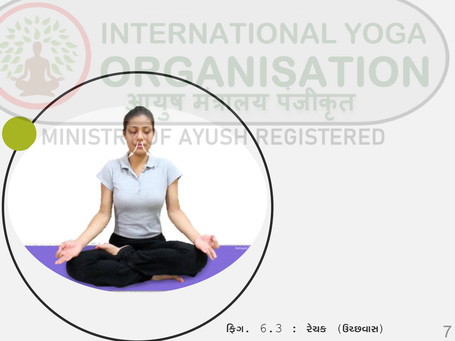
ફિગ. 6.3 : રેચક (ઉચ્છવાસ)

ધીમી અને નિયંત્રિત રીત. કેટલાક યોગ સાધકો જણાવે છે કે રેચક એ સૌથી મહત્વપૂર્ણ પ્રાણાયામ છે (પ્રાણાયામના ભાગનું નિયમન કારણ કે જો શ્વાસ બહાર કાઢવાની ગુણવત્તા સારી ન હોય, તો શ્વાસ) સમગ્ર પ્રાણાયામ અભ્યાસની ગુણવત્તાને અસર થાય છે.