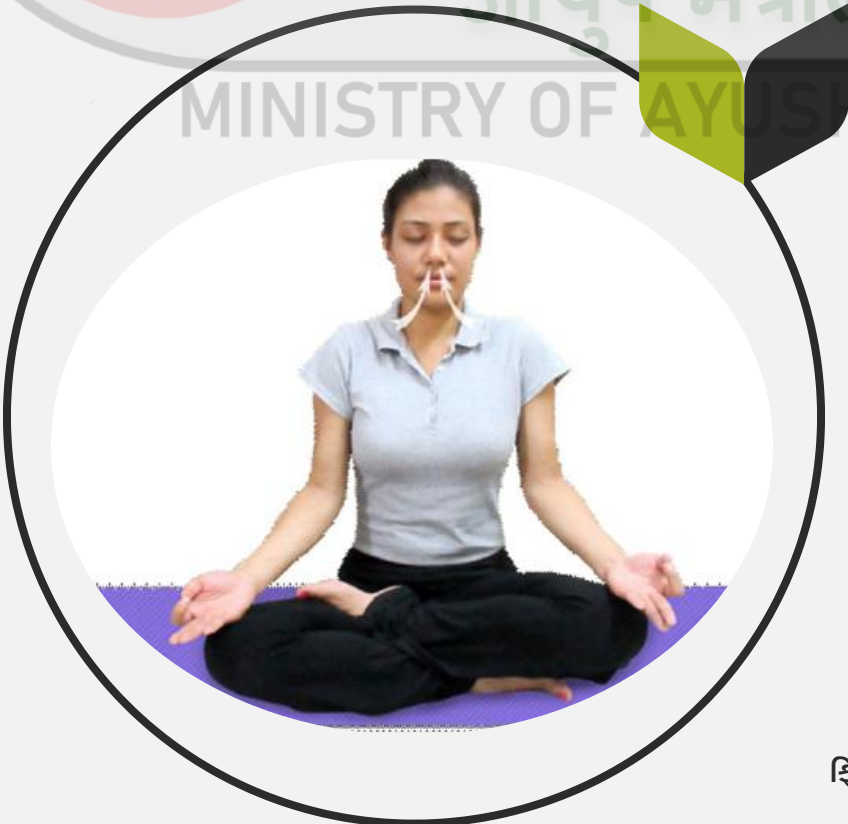
ફિગ. 6.1 : પુરક (ઇન્હેલેશન)

પ્રાણાયામ પ્રેક્ટિસ દરમિયાન તે એક મહત્વપૂર્ણ તબક્કો છે જે ઇન્હેલેશનને નિયંત્રિત કરે છે. તે શરીરની અંદર શ્વાસ લેવાની પ્રક્રિયા છે જે સરળ અને સતત હોવાનું માનવામાં આવે છે.