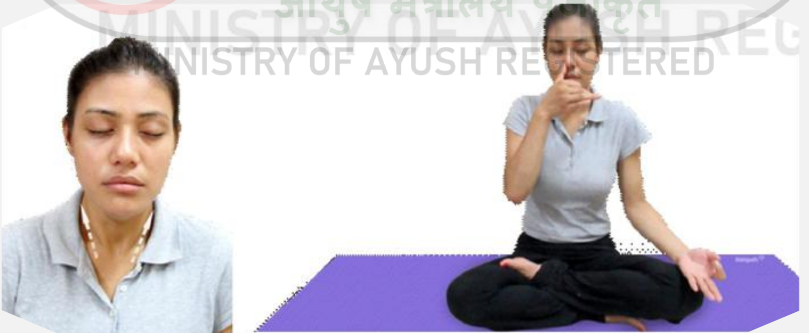
మూర్తి 6.7 : ఉజ్జయి ప్రాణాయామం