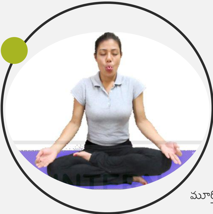
మూర్తి 6.9 : శీతలీ ప్రాణాయామం