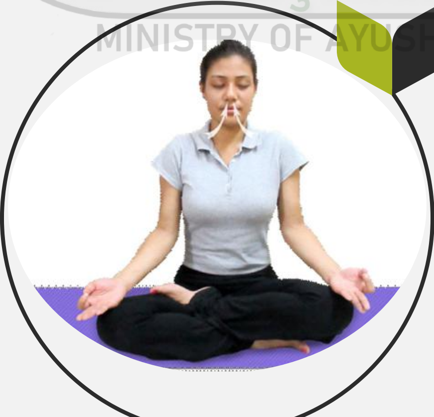
మూర్తి 6.1 : పూరక (ఉచ్ఛ్వాసము)

ప్రాణాయామ సాధన సమయంలో ఇది ఒక ముఖ్యమైన దశ, ఇది ఉచ్ఛ్వాసాన్ని నియంత్రిస్తుంది. ఇది శరీరం లోపల బ్రిత్ డ్రాయింగ్ ప్రక్రియ, ఇది మృదువైన మరియు నిరంతరంగా ఉండాలి.