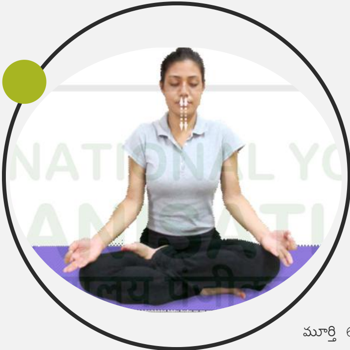
మూర్తి 6.8 : భృశిక ప్రాణాయామం