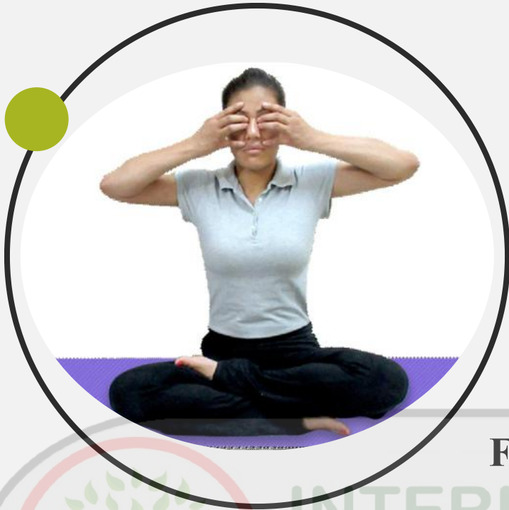
Fig. 6.6 : Bhramari pranayama