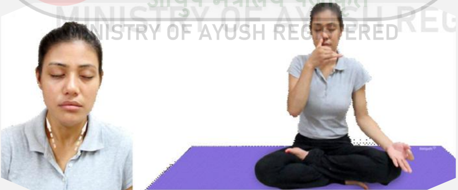
Fig. 6.7 : Ujjayi Pranayama