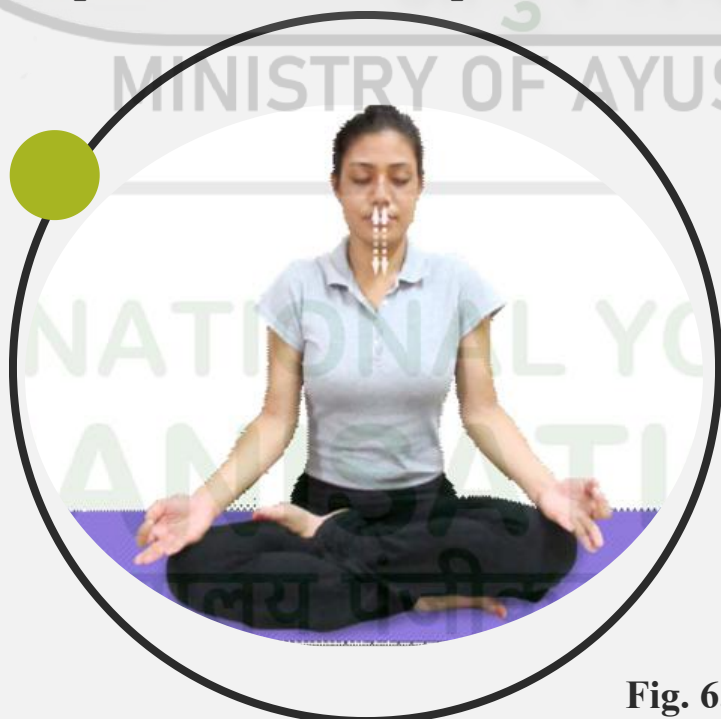
Fig. 6.8 : Bhastrika pranayama