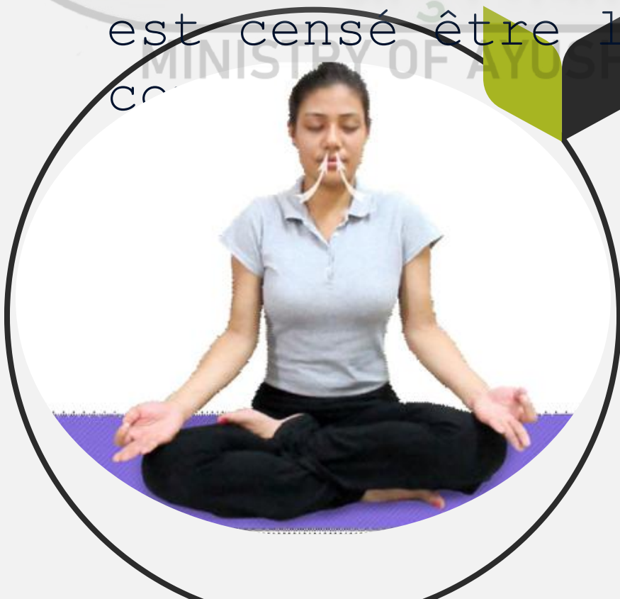
Fig. 6.1 : Puraka (Inhalation)

C'est une phase importante de la pratique du Pranayama qui régule l' Inhalation . C'est un processus d' aspiration de la respiration à l' intérieur du corps qui est censé être lisse et