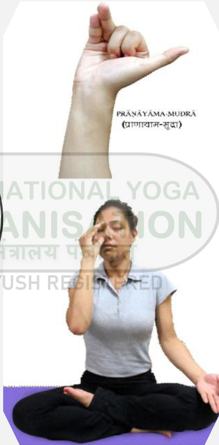
Fig. 6.4(a) : Nadishodhana pranayama 9