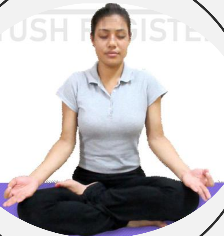
Fig. 6.2 : Kumbhaka (Rétention)

6.2.2.2 Bahya Kumbhaka (rétention d'air à l'extérieur du corps)