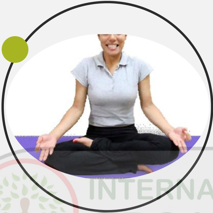
Fig. 6.10 : Sitkari pranayama