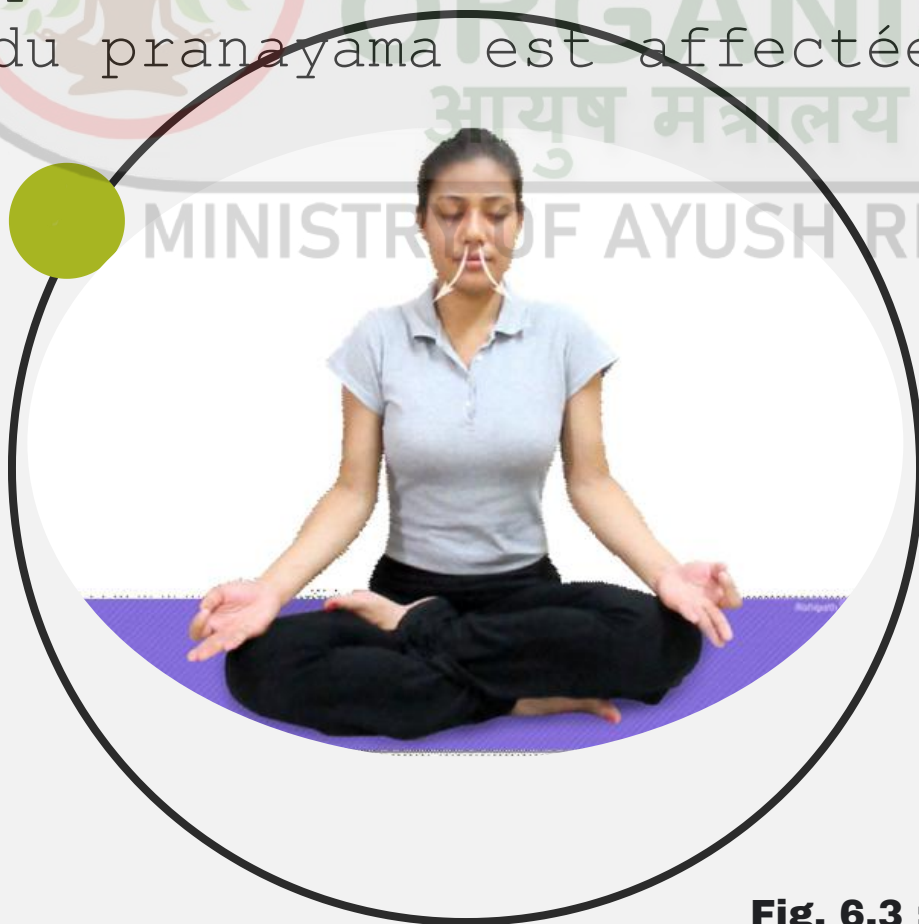
Fig. 6.3 : Rechaka (expiration)

C'est la phase finale de la pratique du Pranayama qui régule la partie Exhalation. C'est un processus d'aspiration de la respiration à l'extérieur du corps qui devrait être un manière lente et contrôlée. Certains pratiquants de yoga déclarent que le rechaka est le pranayama le plus important (régulation d'une partie du pranayama car si la qualité de l'expiration n'est pas bonne, alors la qualité du souffle) de toute la pratique du pranayama est affectée.