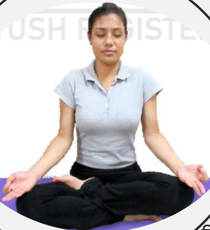
चित्र 6.2 : कुंभक (अवधारण) 6