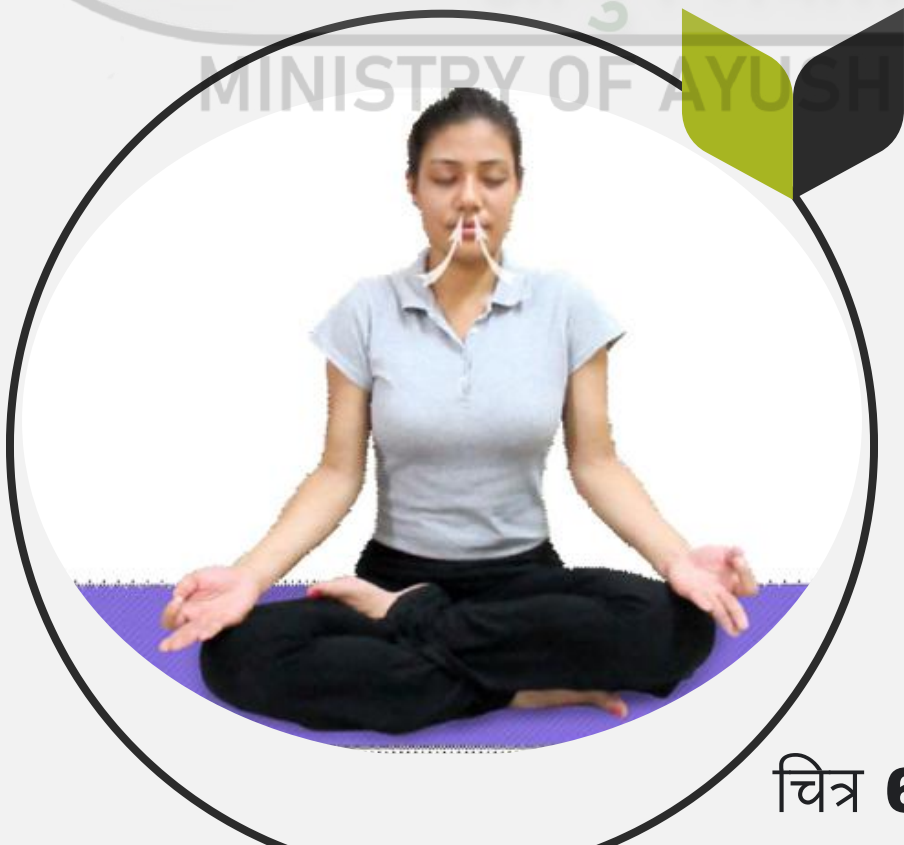
चित्र 6.1 : पुरका (साँस लेना) 5

प्राणायाम अभ्यास के दौरान यह एक महत्वपूर्ण चरण है जो अंतःश्वसन को नियंत्रित करता है। यह शरीर के अंदर सांस लेने की एक प्रक्रिया है जिसे सुचारू और निरंतर माना जाता है।