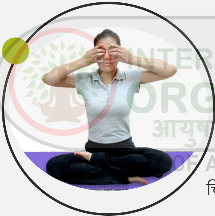
चित्र 6.6 : भ्रामरी प्राणायाम