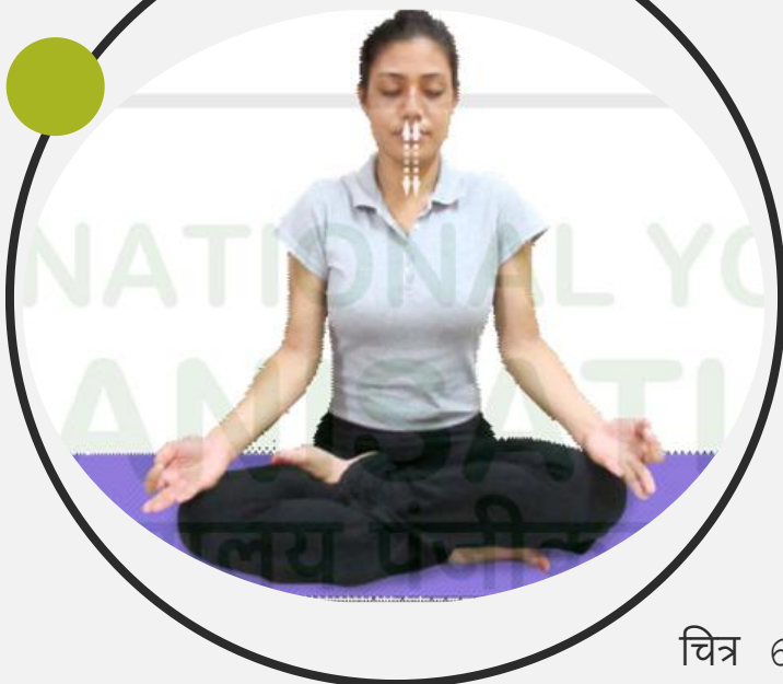
चित्र 6.8 : भस्त्रिका प्राणायाम